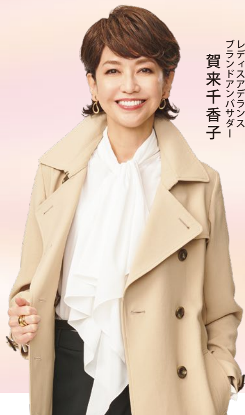
レディスアデランス ブランドアンバサダー 賀来千香子

10:00→19:00 ※最終日は17:00閉場 ※各日最終受付は閉場時間の1時間前まで