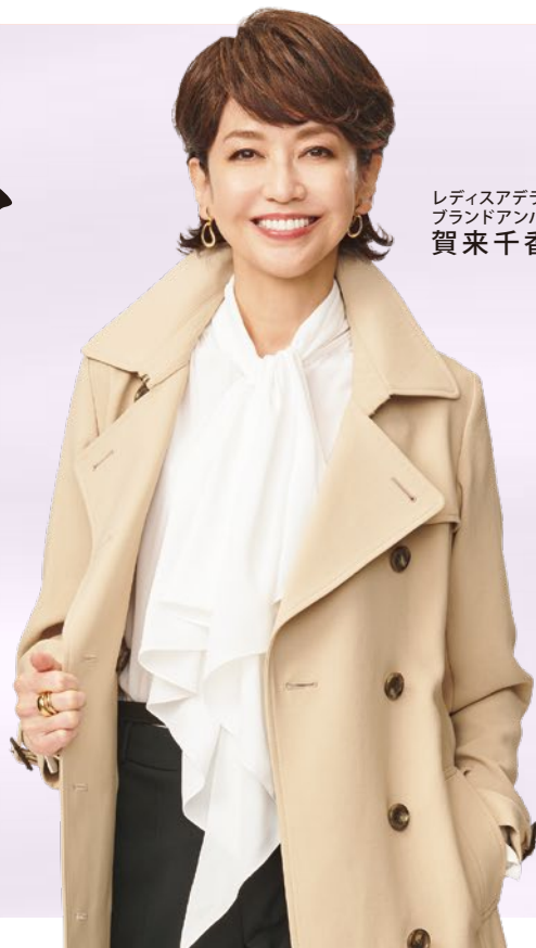
レディスアデランス ブランドアンバサダー 賀来千香子

※最終受付は、各日終了時間の1時間前まで。 ※受付時間は変更になる場合がございます。