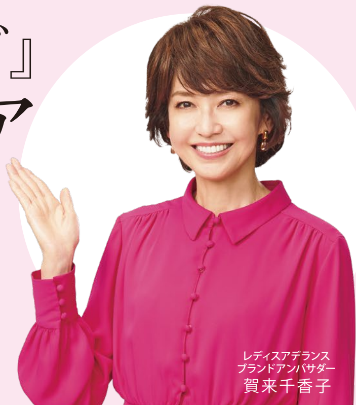
レディスアデランス ブランドアンバサダー 賀来千香子