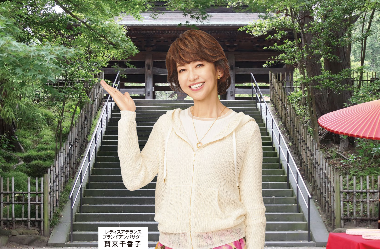
レディスアデランス ブランドアンバサダー 賀来千香子