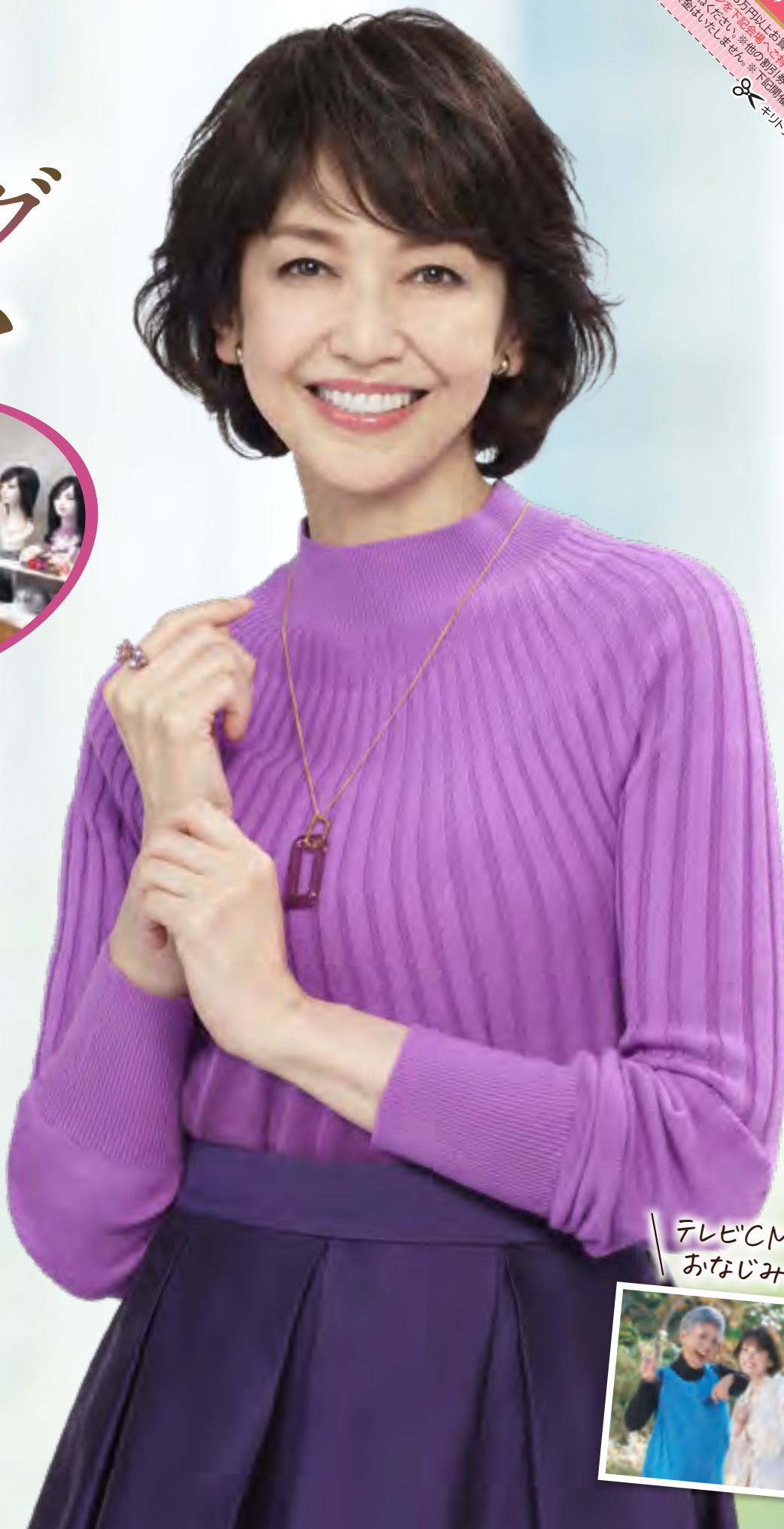
レディスアデランス ブランドアンバサダー 賀来千香子さん

期間限定 割引クーポン 3,000円OFF ※2万円以上お買い上げでご利用いただけます。※会場スタッフに ※本フェアを記念し、お申し込みいただいたお客様の併席はごまかせませ ※送料・梱包費は別途です。※他の割引券との併用はできません。※一人様1回限り有効。 ※キリトリ線