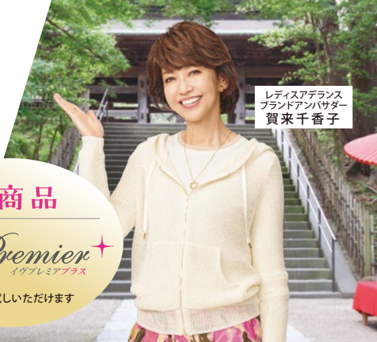
レディースアデランス ブランドアンバサダー 賀来千香子